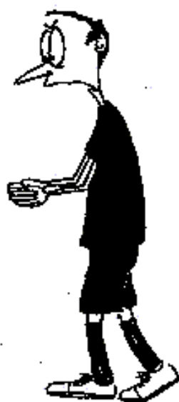
917. Nesprávný výhoz (obě předloktí horizontálně dlaněmi k sobě)