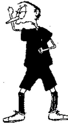
905. Hra hokejkou pod soupeřovým vozíkem ( dlaň šikmo nahoru )