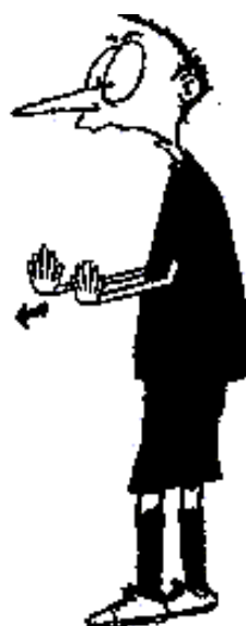
907. Nedovolené vrázení (signál může být proveden jednou rukou)