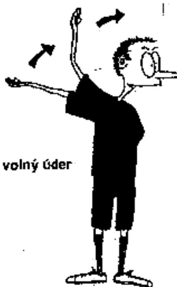
918. Špatně provedené rozehrání nebo volný úder (paže proti směru hry se nad hlavou změní ve správný směr hry)

Nesprávný výhoz, špatně provedené střídání