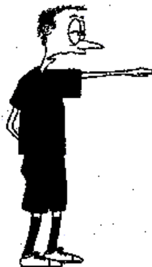
804. Volný úder (paže horizontálně ve směru hry, dlaň dolů)