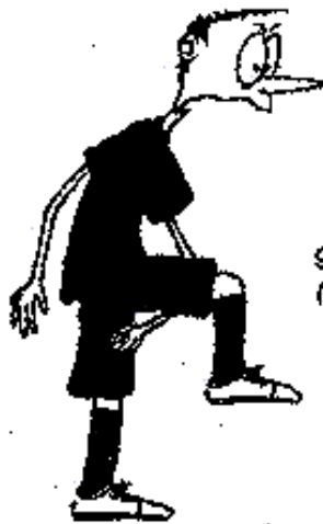
906. Hákování ( předloktí horizontálně, vyznačit držení hokejky )