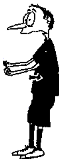
908. Vrážení zády do soupeře (polosevřené ruce dlaněmi nahoru, předloktí táhnout dozadu)