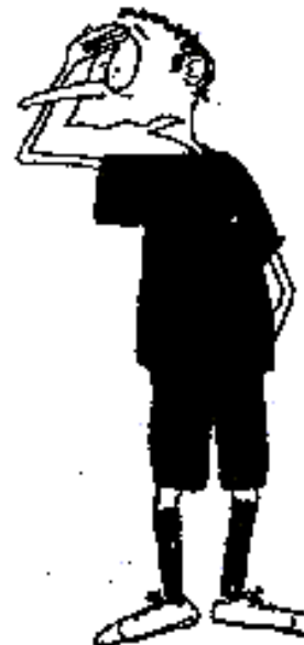
921. Hra hlavou (dlaň ruky na čele)