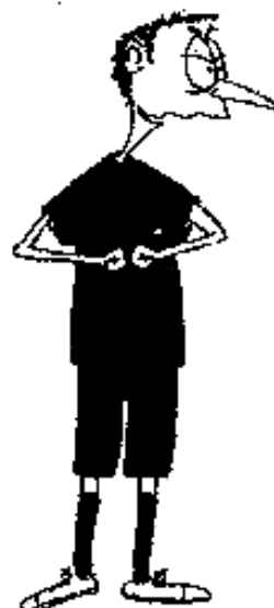
909. Hrubost (pěsti k sobě)

Nedovolené vrázení, vrázení zády do soupeře, hrubost