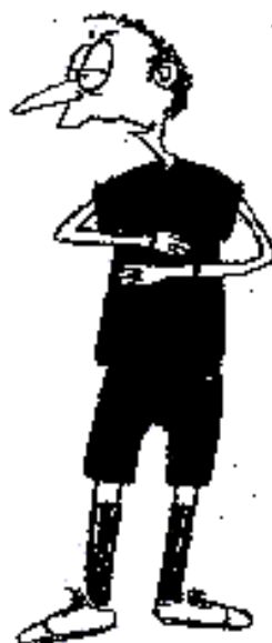
922. Špatné střídání (rotace obou předloktí)