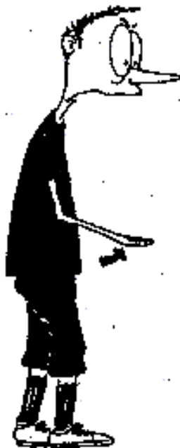
920. Hra rukou (dlaň šikmo nahoru)