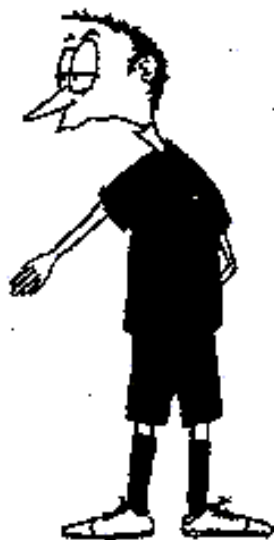
805. Výhoda (Paže ve směru hry, dlaň šikmo nahoru směrem k hřišti)