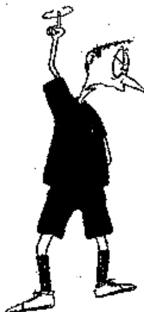
924. Zdržování hry

Špatné střídání, opakované přestupky, zdržování hry