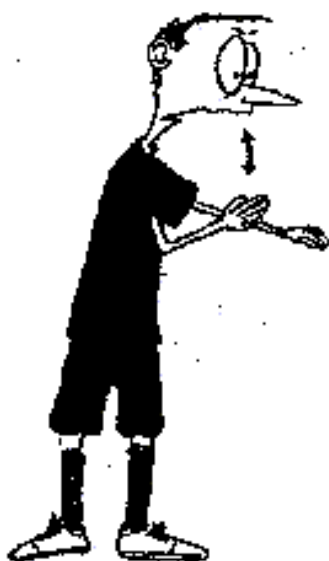
923. Opakované přestupky (tři údery rukou)